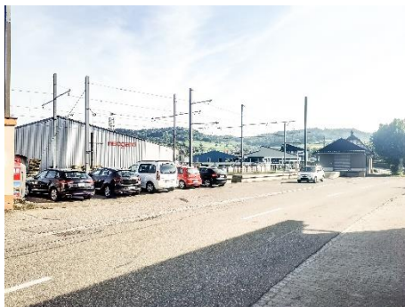
Bahnhof Gontenschwil / Parkplatzanlage